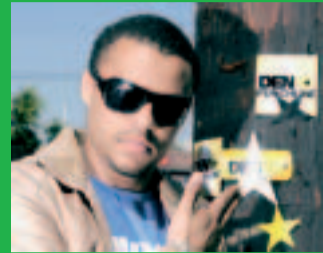
DENYO Du bist Hamburg