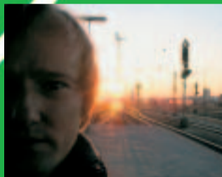
PETER LICHT Lied vom Ende des Kapitalismus