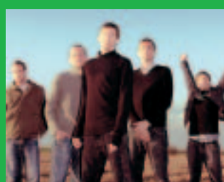
SUE Half Way Home

Es ist Liebe/Das WM-Journal der taz Liebeserklärungen an die 32 Teilnehmer der Fußball-WM 2006 112 Seiten, viele Abbildungen, durchgehend vierfarbig mit CD INTER DEUTSCHLAND, Neue Hymnen und Songs für Deutschland