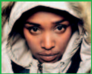
ONEJIRU Prophets of Profit