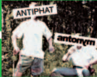
ANTONYM/ANTIPHAT We Are Unentertained