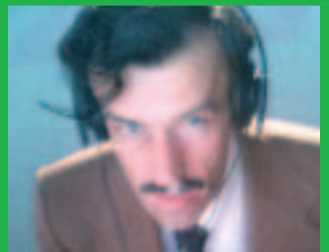
STUDIO BRAUN Deutscher Herbst

Das taz journal »Es ist Liebe« erscheint am 26. April 2006. Preis: 9 Euro. Vorzugspreis: 8 Euro inkl. Porto und Verpackung ( bis zum 22. April 2006)