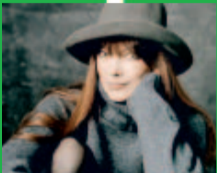
KATJA EBSTEIN Die schlesischen Weber

Deshalb haben wir Bands und Solisten, Newcomer und Popstars um Lieder gebeten, die so sind wie die ganz unglaublichen Momente auf dem Platz: besser. Offener, mutiger, herzlicher, schöner. »Inter Deutschland« versammelt 16 Songs zum Anhören und Mitsingen vor und nach dem Spiel. Weil nach vor ist. Und vor nach. Undsoweiter. Holt euch das Spiel zurück – und die Hymne!